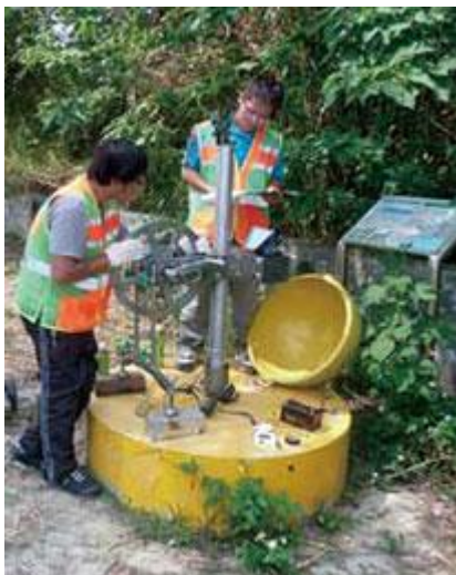
地層下陷監測井監測畫面